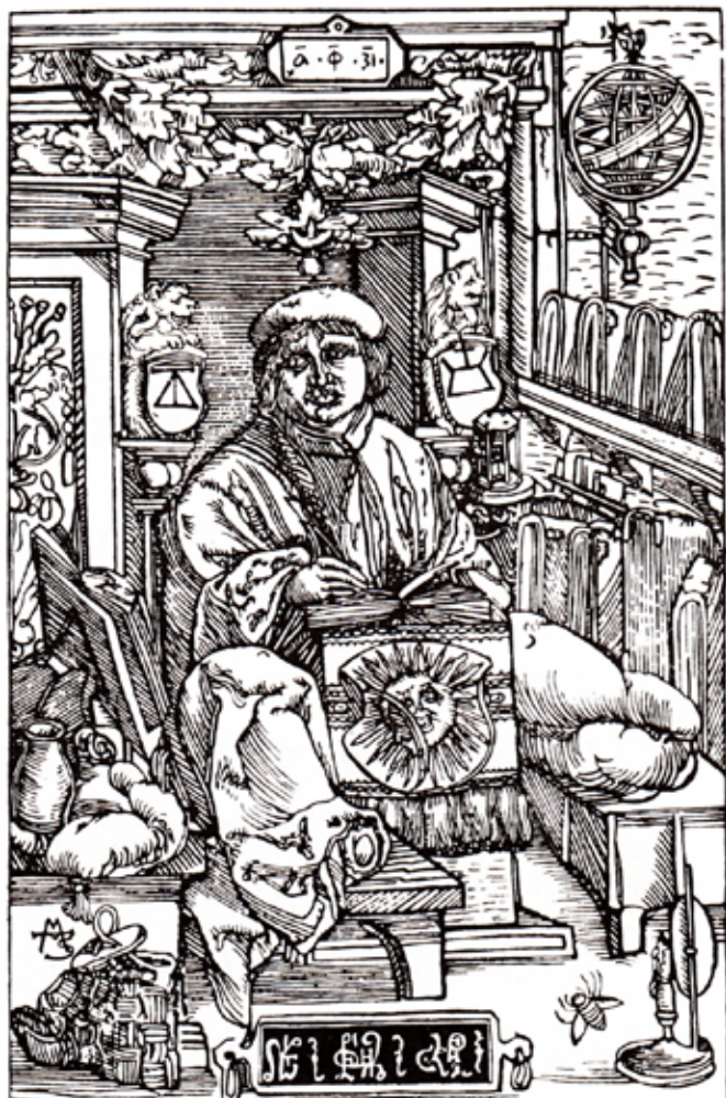
Франциск Скорина. Гравюра 1517 р.