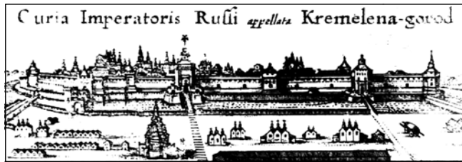
Московський кремль Гравюра початку XVII ст.

ційним визнанням першодрукарем його, а не Івана Федорова, стало оголошення у 2003 році ЮНЕСКО, за поданням Російської Федерації, роком російської книги. Такий ювілей був пов'язаний з 450-літтям виходу вузькошрифтного Євангелія. До слова, саме це анонімне видання має в тексті найбільше українських рис 8 . І не виключено, що згаданий майстер походив з України.